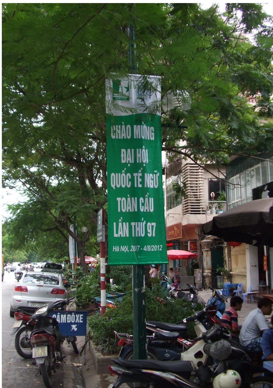
Anonco pri la Esperanto Kongreso en la strato