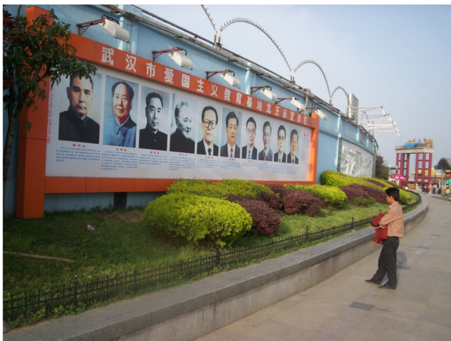
中国特色爱国主义教育：龙王庙前到过此地视察过抗洪事业的党和国家领导人片