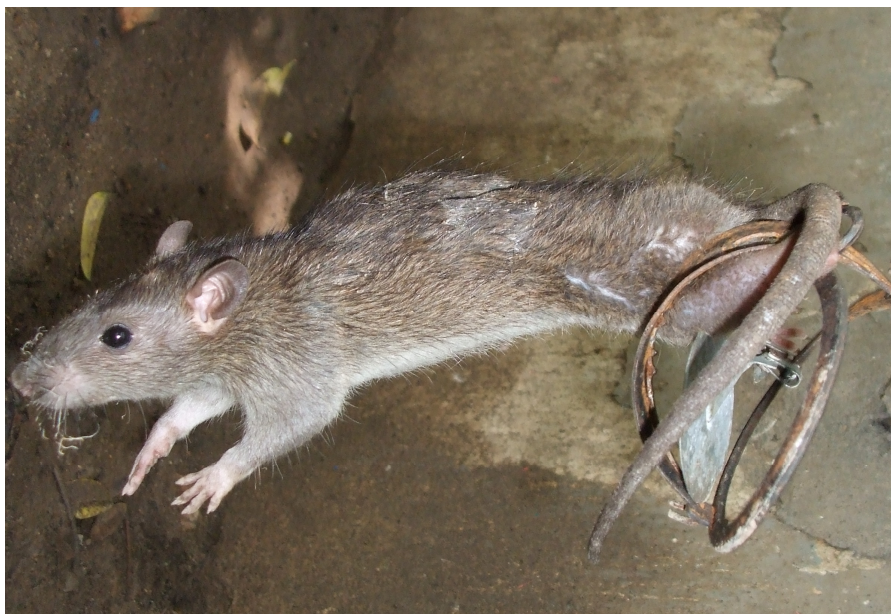
Rato en kaptejo apud restoracio en la Popola Parko en Nanning