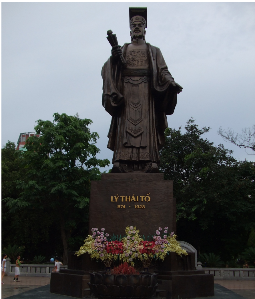
Skulptaĵo de vjetnama nacia heroa reĝo ĉe lago Hoan Kiem

de sudorient-aziaj homoj, ol la kongresanoj, kiuj por 2000 dolaroj aŭ eĉ pli venis ĉi tien kaj partoprenis la kongreson for de la loka komunumo. Estas tiel eĉ se ili pagis aliajn 2000 dolarojn por partopreni multekostegaj postkongresajn ekskursojn, kie ili povis aŭskulti la stereotipajn tekstojn de ĉiĉeronoj pri la politika, ekonomia kaj kultura situacio de la vizitata lando.