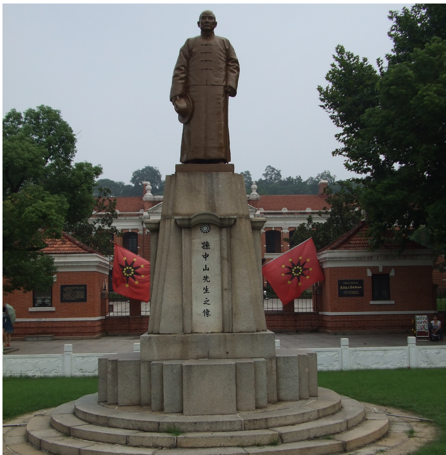
La statuo de D-ro Sun Yat Sen en urbo Wuhan