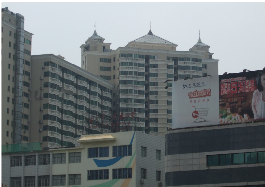
Modernaj konstruaĵoj en Nanning

Fine la policanoj registris la datumojn de la viro kaj foriris plu per alarmaj bluaj lumpulsadoj. La senbiletita pasaĝero kaj la kontrolistoj restis en la bushaltejo. Mi pensas, ke post kelkaj minutoj ili ĉiuj eksidis al la venontan buson, la senbiletulo daŭre sen bileto, kaj ĉiuj iris plu. Estis surprize konsterna, ke por aranĝi tian aferon oni bezonis laŭ la aktualaj malnormalaj hungaraj leĝoj ok oficialajn homojn (eĉ entute dek, se oni kalkulas ankaŭ iliajn ĉefojn telefone engaĝitajn). Sed kiel ni vidis, ili eĉ dekope ne sukcesis solvi la aferon.