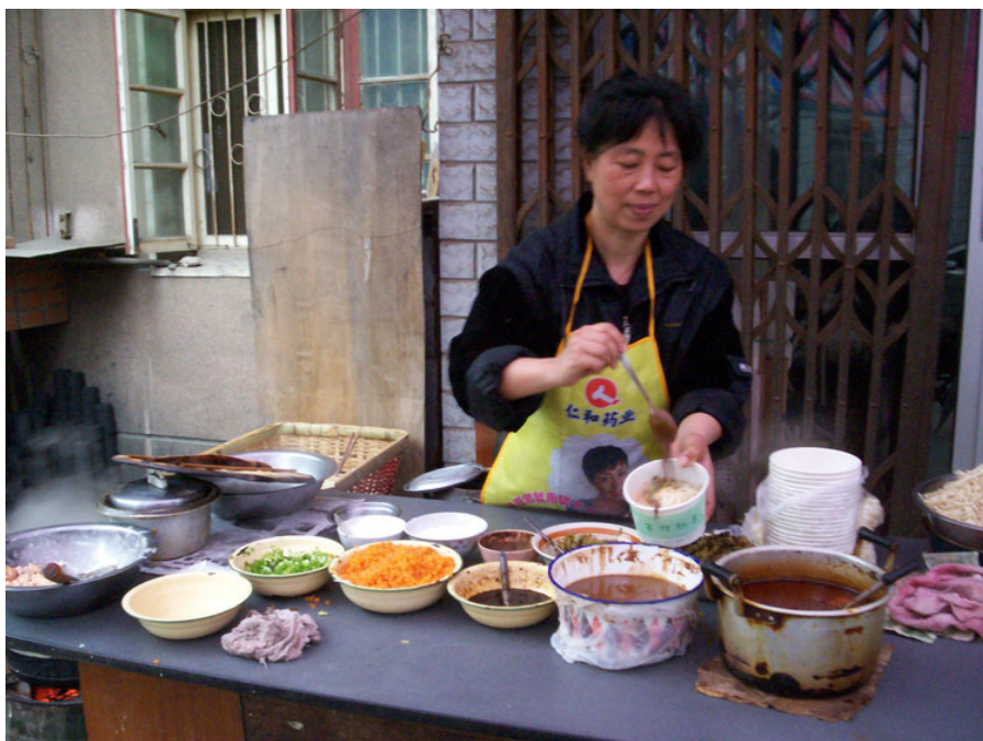
随处可见的街头小吃摊；武汉特有的热干面。