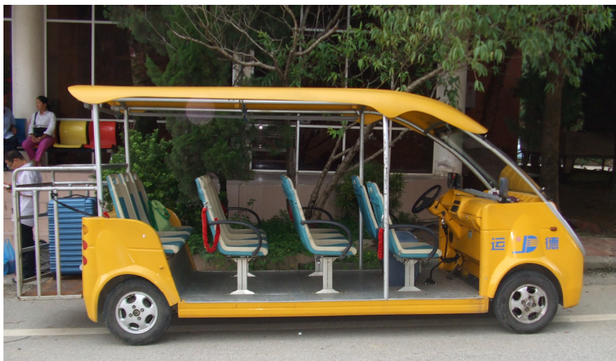
Veturilo ĉe la vjetnama-ĉina landlimo

Mi ne volis akcepti la koloran etiketon, ĉar mi jam havis hejme multajn similajn memoraĵojn, kiujn mi kolektis en diversaj landoj de la mondo. Sed kiam mi vidis, ke ĉiuj vojaĝantoj havis ĝin en la kolo, ankaŭ mi metis unu tien. Sur tio estis pentrite ludkarto: keroa damo. Intertempe mi vidis, ke la homoj, kiuj montradis diverskolorajn monbiletojn estis vere monŝanĝistoj, ĉar pluraj ŝanĝis iliajn vjetnamajn dongojn al ĉinaj juanoj. Kiam mi en la vico povintus ŝanĝi mian restintan monon, tiam mia eta veturilo ekiris kaj mi postkuris ĝin por eviti, ke ĝi forportu mian valizon al nekonata loko.