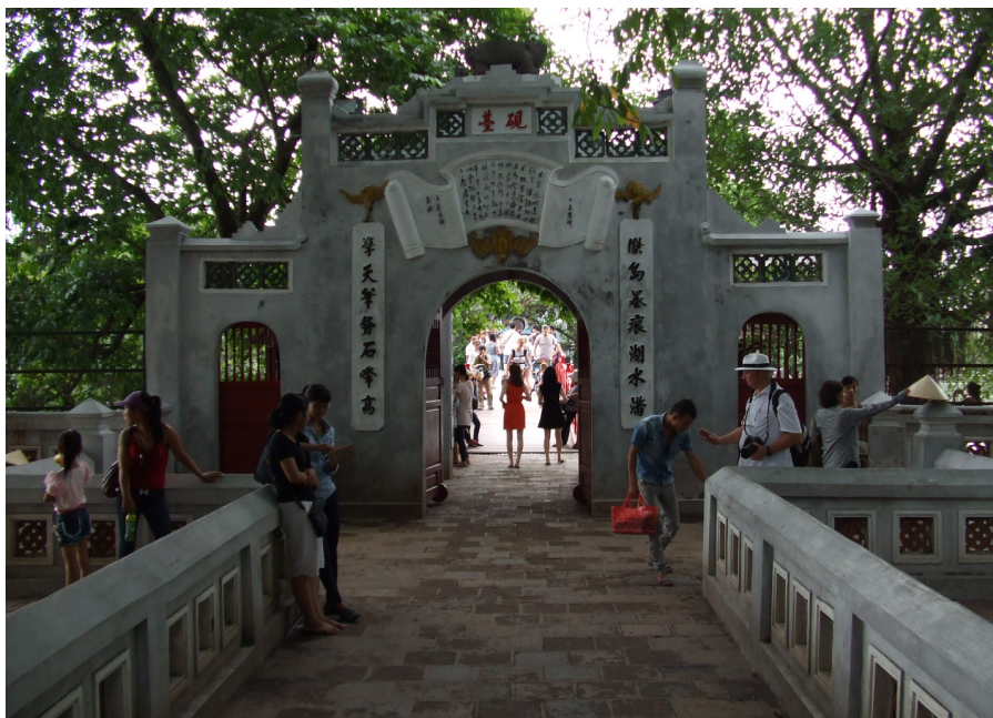
La pordo kondukanta al la „ Ponto al la Matena Sunlumo ” ĉe la bordo de lago Hoan Kiem

Eble mi trofantaziis la situacion kaj la knabinoj estis simple malsataj. Ĉiukaze mi diris, ke mi jam unufoje vespermanĝis kaj post la manĝo de riĉe farĉita giroso kun rostita viando mi jam ne povus manĝi plian vespermanĝon. La knabinoj komprenis tion nature kaj diris, ke ili ĵus rimarkis, kiom malfrua la tempo estis. Ili diris, ke ili devis tuj hejmeniri. Tial ni rapide adiaŭis unu la alian en la ankoraŭ iom stufe varma hanoĵa lagobordo.