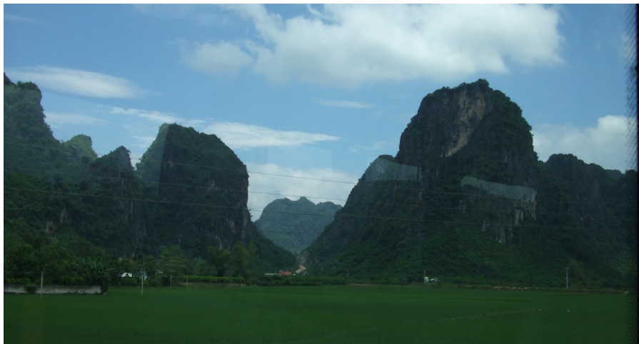
Belaj montetoj apud la nanninga vojo

Antaŭ ekveturo mi ŝatintus havi varman matenmanĝon, ekzemple bone spicitan akran buljonon, sed estis neniu loko en la proksimo, kie oni povis matenmanĝi. Mi esperis, ke sur la buso sur tabulo estos skribita vjetname aŭ ĉine kien iros la buso. La vorton Nanning mi povis legi kaj vjetname kaj ĉine. La nomo de la urbo vjetname estas Nam Ninh, ĉine 南宁. Inter ili la unua ideogramo signifas "suda" kaj la dua "trankvilo". La signifo de la urbonomo estas " Urbo de Suda Trankvilo ". La buson ironan tien mi rekonintus, se la nomo de celhaltejo estintus skribite sur la buso. Sed okazis, ke sur la busoj estis skribite nenio, nek vjetname, nek ĉine. Mi provis nur laŭ supozo aliri al iu buso haltanta antaŭ la koncerna domo por demandi, ĉu la buso iros al Nanning. Mi havis bonŝancon, ĉar ĝuste tiu buso preparis iri al Nanning.