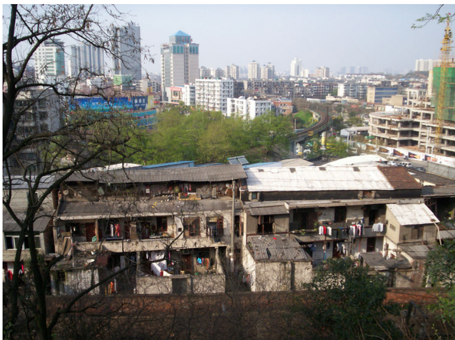
新旧嬗变中的武汉城市面貌。