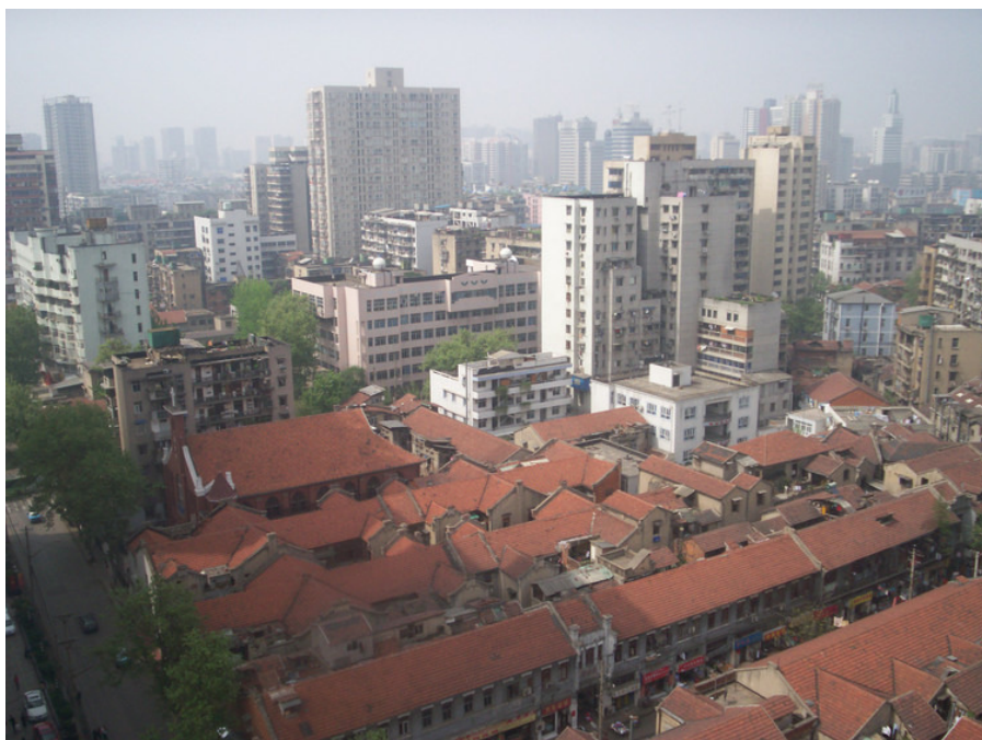
历史和现实交相辉映：被保护的汉口老街区。