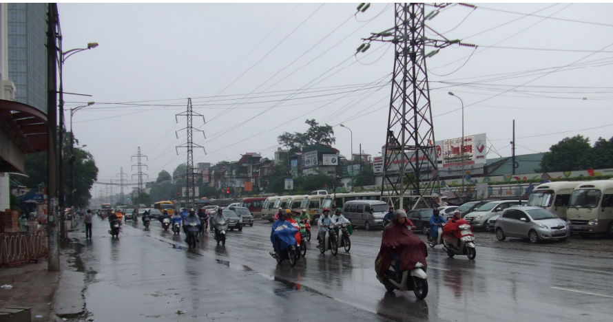
La hanoja bushaltejo al Nanning

Mi ne finkalkulis ĉiujn elspezojn kaj enspezojn, sed mi havis la senton, ke la lastan tagon en Hanojo mi havis eble pli da mono, ol mi havis ĉe mia ekiro el Budapeŝto. Tio estis pro la fakto, ke mi vivis en Hanojo modeste, kiel la vjetnamoj. Mi iris tagmanĝi kaj vespermanĝi al nekostaj restoracioj, kiel vjetnamoj, mi luis hotelĉambbron simplan, tamen komfortan, klimatizitan, ekipitan per fridujo, varmakva banĉambro kaj mi sukcesis akiri malmultekostan busbileton pluveturi al Ĉinio. Krom tio mi ricevis honorarion 250 eŭrojn pro mia prelego de la kongresa universitato kaj venis ankaŭ signifa mono vendante miajn librojn.