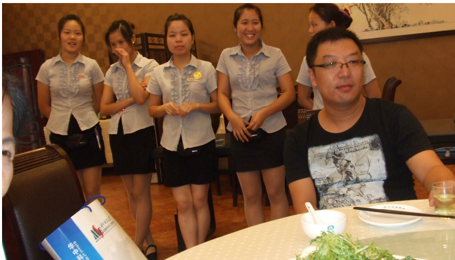
Multaj kelnerinoj servas en eleganta restoracio

La raportoj pri mia vojaĝo aperis ankaŭ eksterlande. El pluraj lokoj venis pretendoj, ke la raportaĵaron estus bone eldoni ankaŭ libroforme. En Japanio oni kompletigis mian verkon, aldonante, ke la kantojn glorigantajn prezidenton Mao - kiel tion mi menciis en la antaŭaj ĉapitroj - volonte kantis eĉ grupo de japanaj gestudentoj. Inter ili ankaŭ la kanto “東方紅” (Dong fang hong “Ruĝas la oriento”), kiun en la periodo de ĉina kultura revolucio oni povis ofte aŭdi eĉ en Japanio en la origina ĉina lingvo. Japana traduko de la tiam tre populara kanto ne aperis eble eĉ ĝis nun.