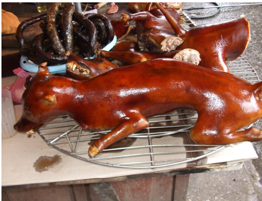
Rostitaj hundoj kaj hundokolbasoj en la merkato

La programoj de la kongreso estis tre interesaj por mi kun multaj novaĵoj, ĉar en la lastaj 15-20 jaroj mi kutime ne partoprenis tiajn kongresojn. Pasintjare mi povis ĉeesti kelkajn programojn de la UK en Kopenhago, sed la tutan kongreson mi ne partoprenis, ĉar tiu vojaĝo celis plurlandan turisman viziton. Tial mi nun travivis kun granda surprizo, ke multaj homoj venis al mi kaj volis min inviti al tagmanĝo aŭ vespermanĝo. Ili ĉiuj ekkonis min, iu diris, ke li vidis min en Belgio antaŭ multaj jaroj, aŭ ni renkontiĝis en Koreio, aŭ eble en Japanio. La vendisto de la libroservo venis al mi dirante ke sia edzo aŭskultis mian prelegon kaj diris, ke ankaŭ ŝi ŝatus aĉeti miajn librojn. Mi ne povis imagi kiel ŝi povis ekkoni min inter okcent homoj en la granda homamaso.