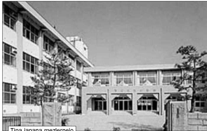
Tipa japana mezlernejo