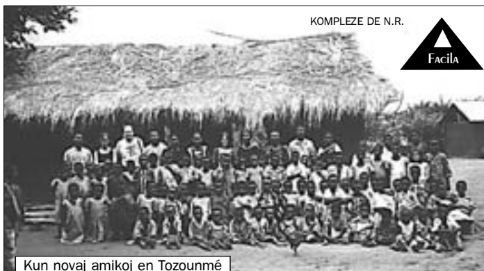
Kun novaj amikoj en Tozounmé

- Mi kompreneble sciis, ke ni iros al tre malriĉa lando, kie ĉio mankas (akvo, elektro, manĝaĵo, edukado...) kaj certe provis imagi,