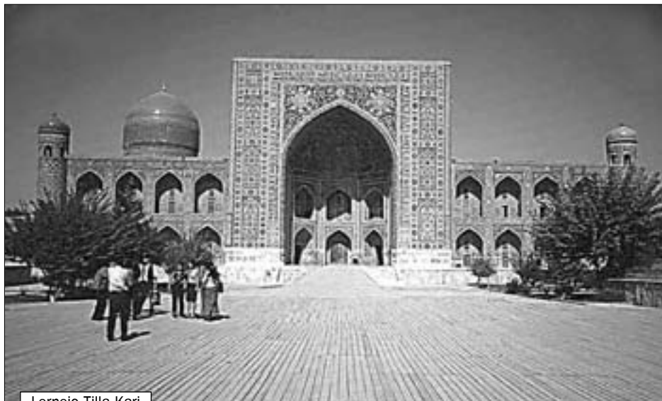
Lernejo Tilla Kari

Oni opinias, ke budhismo, naskiĝinta en Hindio je la limo inter la kvina kaj la kvara jarcentoj a. K., enpenetris Ĉinion kaj poste Japanion kaj Koreion tra Okcidenta Hindio kaj Kuŝana regno***, sur kies teritorio tiam situis ankaŭ Samarkando. Fakte zoroastrismo kaj budhismo paralele kunekzistis ĉi tie ĝis la oka jarcento.