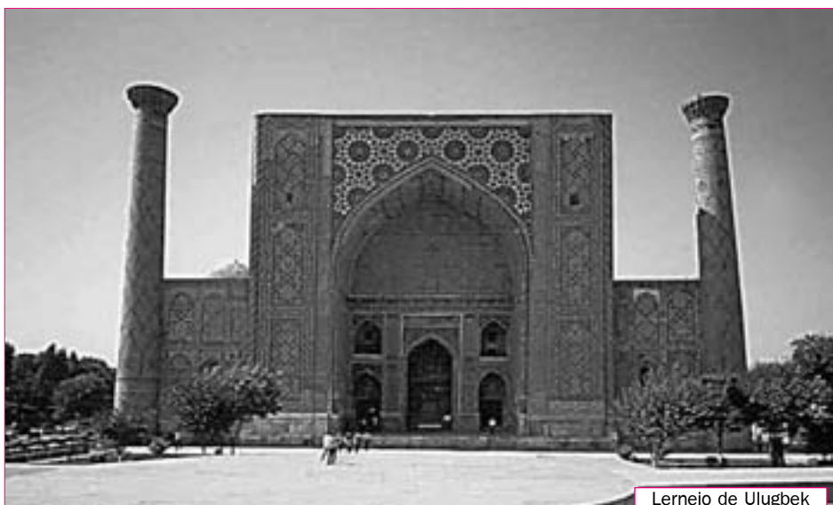
Lernejo de Ulugbek

Unuflanke, islama kulturo malpermesis figuri homojn kaj bestojn (“oni ne rajtas fig-