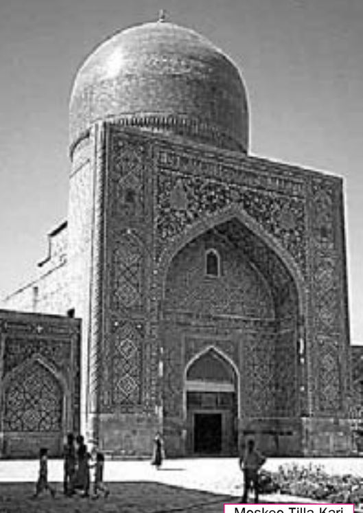
Moskeo Tilla Kari

uri tion, kio estis kreita de Dio!”). Sed ne nur figuri oni ne rajtis – eĉ en ĉiutaga vivo oni ne povis kaj ofte ĝis nun ne povas publike montri nudajn korpomembrojn: korpo, sentoj ktp. estis ĉiel maskataj kaj ŝirmataj. Samtempe ankaŭ la konstruaĵoj, kreitaj de homoj, ne povas esti nudaj, precipe se ili estas sanktaj objektoj. Tial oni “vestis” ilin en ornamaĵojn kaj kovris kvazaŭ per mozaika “tatu”. Vi ne trovos similan eksteran ornam-manieron en la Okcidento. Ne troveblas ĝi ankaŭ en aliaj landoj de la Oriento, ekzemple, en Japanio, kie, laŭ mi, la arta arkitektura tradicio trovis sian plej superan esprimon en kreado de perfektaj formoj.