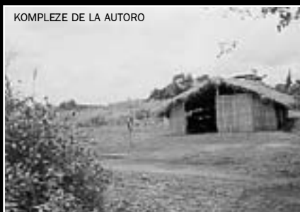
KOMPLEZE DE LA AUTORO