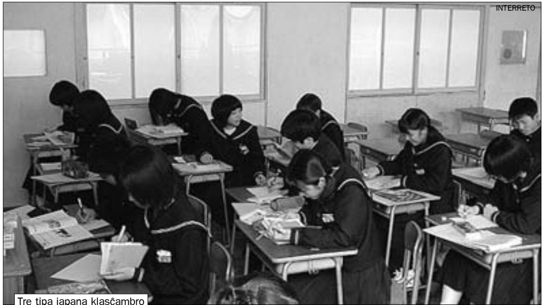
Tre tipa japana klasĉambro