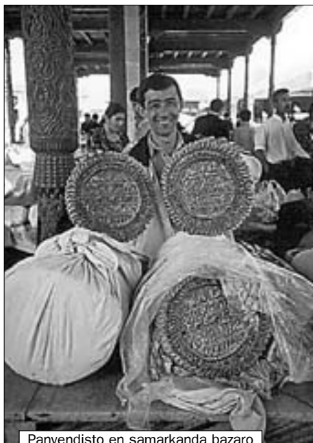
Panvendisto en samarkanda bazaro

Antaŭnelonge la uzbekia urbo Samarkando estis listigita en la Listo de Kultura