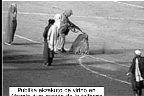
Publika ekzekuto de virino en Afganio dum regado de la talibano