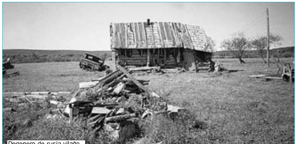
Degenero de rusia vilaĝo

Komparu salajrojn de germana kaj rusia kamparano en manĝaj-ekvivalento. Do, kontraŭ averaĝa hora salajro oni povas aĉeti: