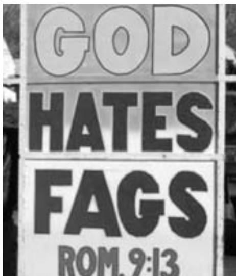
Tekstas: “Dio malamas gejaĵojn”. Ĉu la skribinto eĉ unufoje legis la vortojn de Jesuo?..

Sed se serioze konsideri la tekston mem, aperas multaj kialoj ne kompreni ĝin kiel kondamnon de geja vivstilo laŭ la moderna difino. La ĉefa kialo estas ke Paŭlo mencias ŝanĝon de la natura uzado en kontraŭnaturan . Tio signifas, ke temas ne pri homoj, kiuj denaske aŭ dejunaĝe havas konstantan inklinon al la sama sekso – ĉar por ili inklinado al la sama sekso estas ja natura – sed pri aliseksmaj homoj, kiuj, ĉu pro distro aŭ, plej verŝajne, pro partopreno en paganaj seksritoj, faras samseksajn agojn. La vortoj “fordonis” kaj “ŝanĝis” indikas, ke neniel temas pri homoj kun denaska samseksa inklinado, sed pri transiro de natura sekso inklinado al malnatura. Tio signifas, ke se aliseksmuloj partoprenas samseksajn kondutojn, tio, por ili, estas kontraŭnatura. Aliflanke, laŭ la sama logiko, por homoj, kiuj jam de junaĝo sentas inklinon nur al la sama sekso, partopreni aliseksajn kondutojn estus same kontraŭnatura.