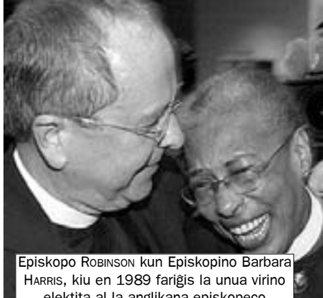
Episkopo ROBINSON kun Episkopino Barbara HARRIS, kiu en 1989 fariĝis la unua virino elektita al la anglikana episkopeco

Liberalaj aŭ progresemaj kristanoj, aliflanke,