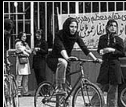
Foto 1 (la 19a jarcento): persa virino. Fotoj 2-3 (la 21a jarcento): civila malobeo kontraŭ diskriminacio. La publika afiŝo en Tehrano tekstas: “Laŭ la religia ordono (Fatva) de la irana plej supera ĝvidanto, virinoj ne rajtas bicikladi publike”. Kiudirekten iras la tempo?..