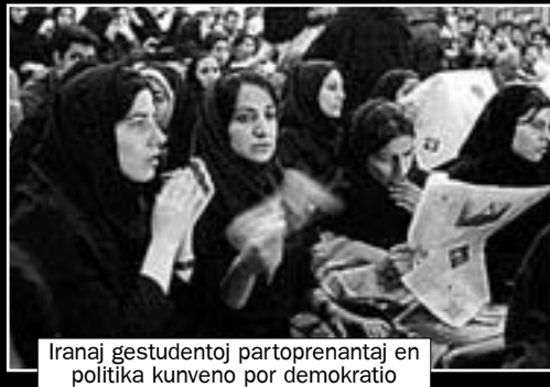
Iranaj gestudentoj partoprenantaj en politika kunveno por demokratio