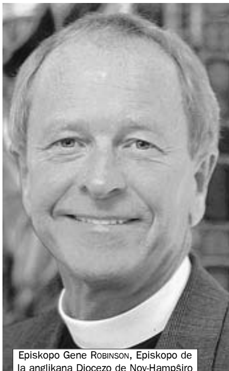
Episkopo Gene ROBINSON, Episkopo de la anglikana Diocezo de Nov-Hampŝiro

Tra la historio de kristanismo samseksema konduto estis ĝenerale universale kondamnata kiel "abomenaĵo", t.e. terura peko antaŭ Dio, kaj do neniel toleribla. Sed ĉi tiu sinteno de kristanismo ne nepre spegulas iun universalan aŭ "naturan" juĝon, ĉar en la helena kaj romia socioj samseksema konduto estis tolerata kaj akceptata. Sed pro la influo de kristanismo sur okcidentan kulturon samseksemeco iĝis konsiderata io "malnatura"... eĉ post la malfortiĝo de eklezia influo. Antaŭe eĉ psikologoj konsideris samseksemon psika malsano. Nur fine de la 20a jarcento pro evoluoj en psikologio kaj sociaj progresoj sur diversaj kampoj (virinaj rajtoj, sekse emancipiĝo ktp.) sintenoj pri samseksemeco ŝanĝiĝis. En la lastaj jaroj tiu evoluo finfine atingis la ekleziojn... kaj nun la reakcia kaj progresema kampoj luktas inter si por decidi la direkton de kristanismo. Unue ni skize rigardu la alirojn de konservativuloj kaj liberaluloj al religio, kaj poste pli precize ekzaminu la tradiciajn argumentojn, kiuj kondamnas sam-