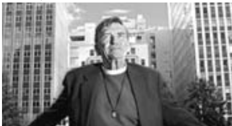
Episkopo John S. SPANG – heroo de liberaluloj kaj malamiko de fundamentistoj kaj konservativuloj pro siaj liberalaj ideoj pri la roloj de virinoj kaj gejoj en la eklezio kaj sia ekstreme neortodoksa teologio

kaj tiel same ankaŭ la viroj, forlasante la naturan uzadon de la virino, brulis en sia volupto unu al alia, kaj viroj kun viroj faris hontindaĵon kaj ricevis en si mem la taŭgan rekompencan de sia malvirto. ” (Romanoj 1:26-27). La unua kritiko de argumento, bazita sur ĉi tiu teksto, estas kritiko de la ĝenerala sinteno de Paŭlo pri diversaj sociaj temoj. Ekzemple, Paŭlo konsideris sklavecon normala, kaj instruis, ke virinoj silentu en la preĝejo, humile obeu sian edzon, kaj ne portu oron aŭ aliajn ornamaĵojn. Modernaj kristanoj ĝenerale ne obeas ĉi tiujn instruojn – do kial obei unu instruon de Paŭlo, sed aliajn ne?