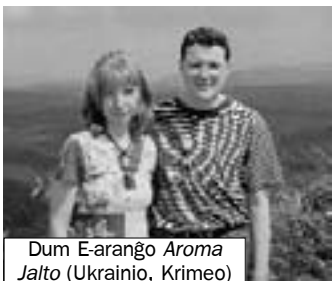
Dum E-araĝo Aromaj Jalto (Ukrainio, Krimeo)