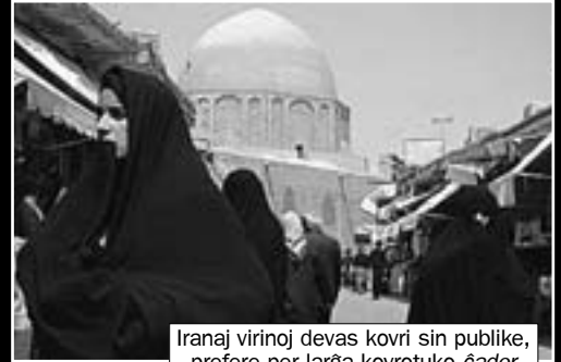
Iranaj virinoj devas kovri sin publike, prefere per larĝa kovrotuko ĉador