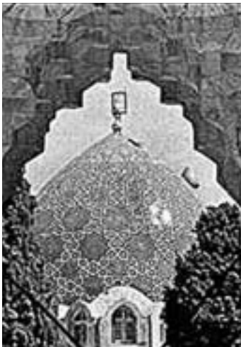
Mondfamaj iranaj artoj: arkitekturo kaj tapiŝ-tekstado; pri la lasta okupiĝas nur virinoj