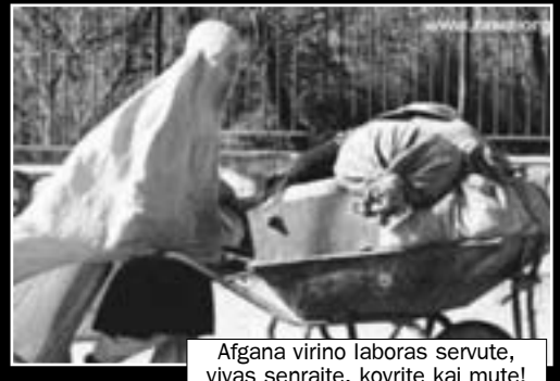
Afgana virino laboras servute, vivas senrajte, kovrite kaj mute!