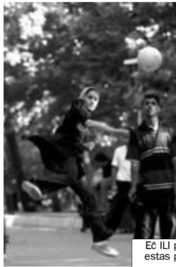
Eĉ Ili povas esti arestitaj! En Irano al virinoj estas permesate nek sportludi publike, nek vesti sin tro moderne...